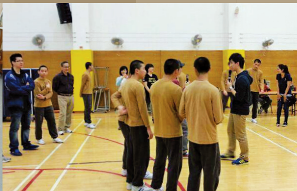
男童院節期綜合活動情景