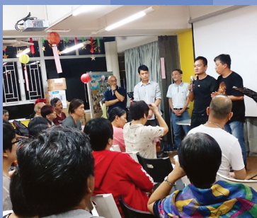
深恩團契中秋節聚會