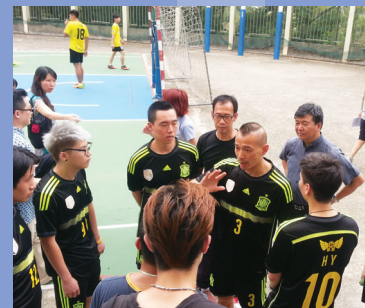
足球四角賽(更生人士與教會對賽)