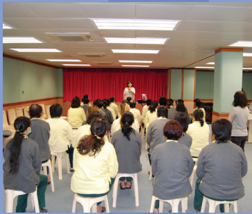
小欖精神病治療中心復活節佈道聚會