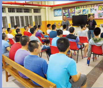
勵恆更生中心復活節佈道聚會