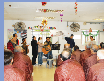
馬坑監獄聖誕節佈道聚會