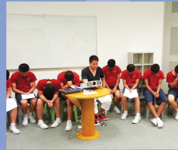
屯門兒童院感化部宗教班