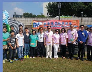
更新會於赤柱監區的秋季賣物會