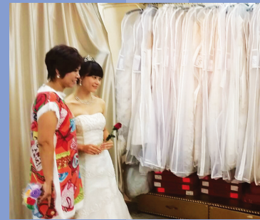
婚禮統籌之拍攝婚紗照