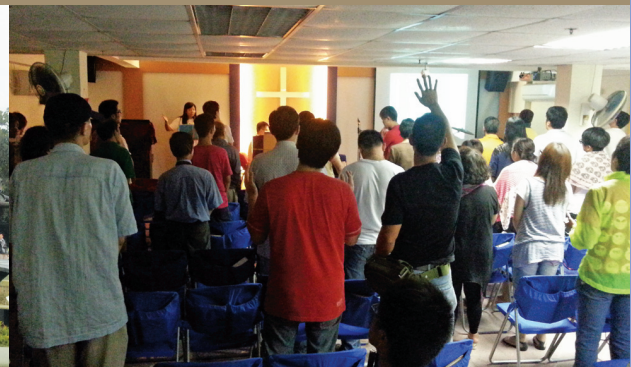
深恩團契聚會時刻