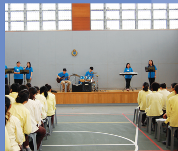
羅湖懲教所(西翼)復活節佈道聚會