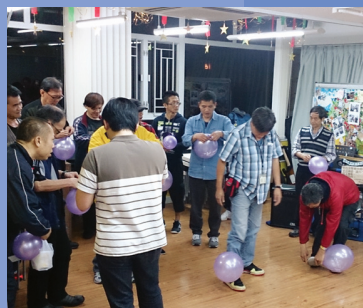
深恩團契生日會遊戲時間