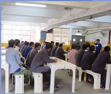
勵新懲教所青少年戒毒中心復活節佈道