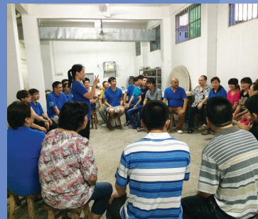
阿尼西母學員團隊往東莞工廠短宣