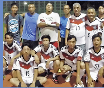
新聯盟更新足球隊