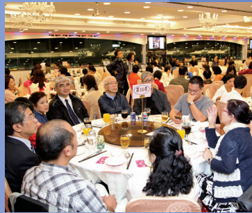
座無虛席的35週年感恩聚餐