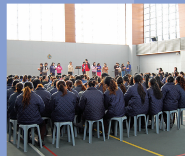
羅湖懲教所(主翼)元旦佈道聚會