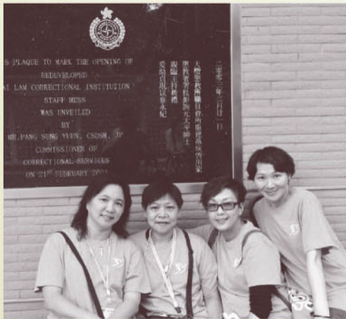
筆者(右一)攝於大欖懲教所更新會步行籌款活動